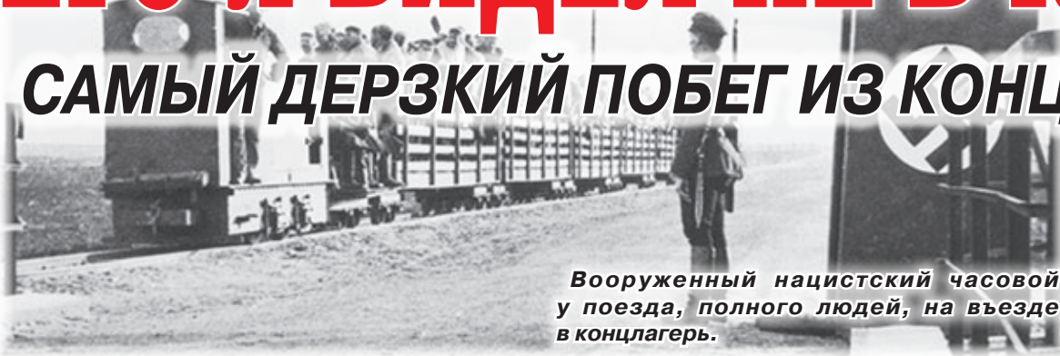
Вооруженный нацистский часовой у поезда, полного людей, на въезде в концлагерь.